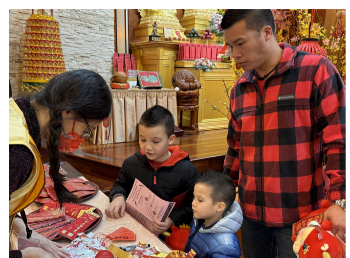
小菩薩為家人挑選感恩祝福卡。