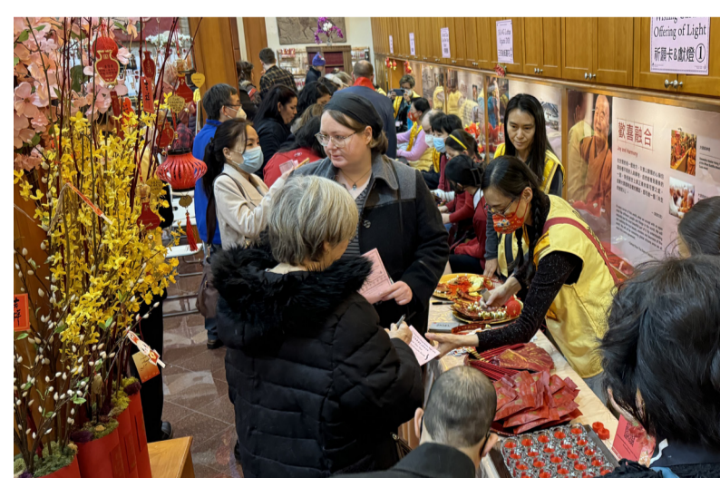
芝加哥佛光山周邊的芳鄰們，有機會走進佛教寺院，體驗一場富有「人間佛教」精神的文化饗宴。