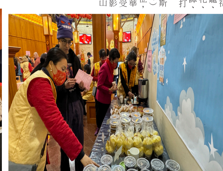
新春素食義賣，品嚐家鄉年味。