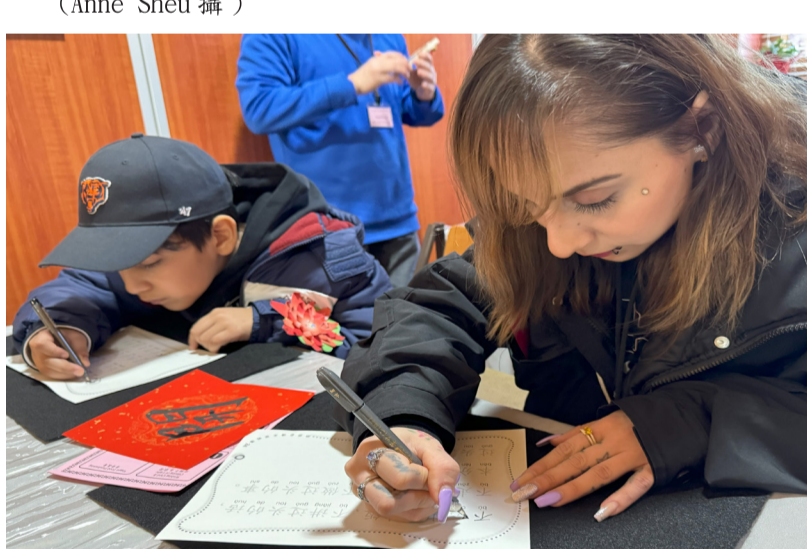
母子專注抄寫「佛光菜根譚」。