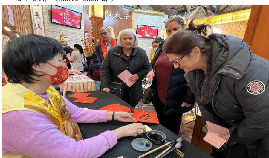
來賓抽字卡後，再由義工揮毫於春聯上，並解說字中禪意。