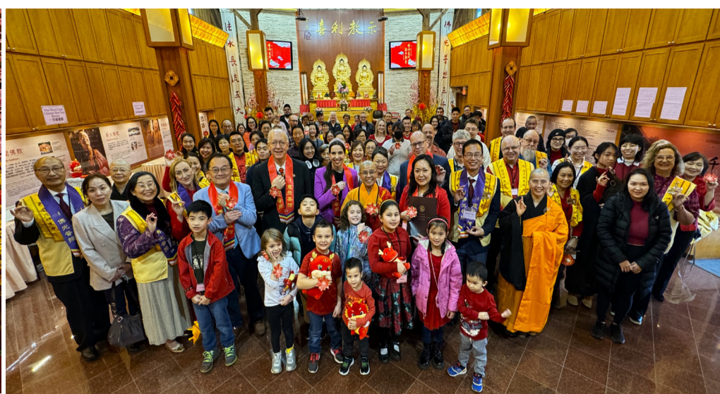
芝加哥佛光山「新春文化 Open House」活動，近250位中西人士共襄盛舉。