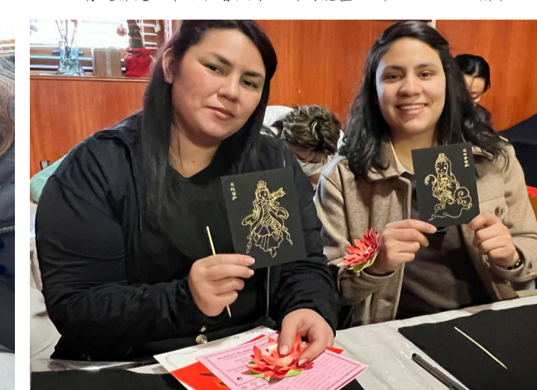
為自己摺出代表歡喜和諧的蓮花。