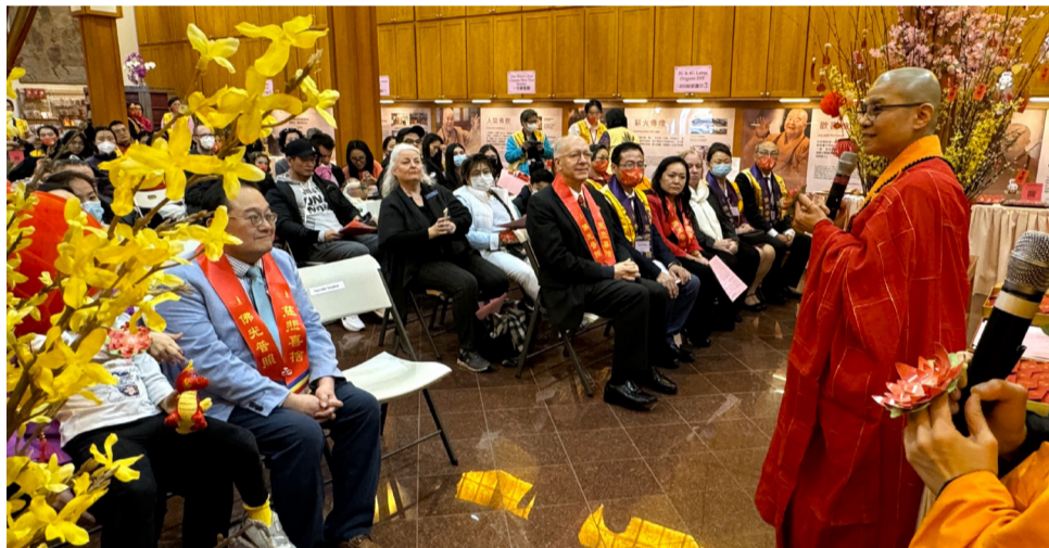
住持 永瀚法師開示大眾奉行星雲大師「三好四給」的教導，並在日常生活中實踐。