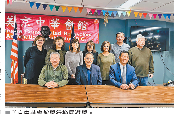
美京中華會館舉行換屆選舉。