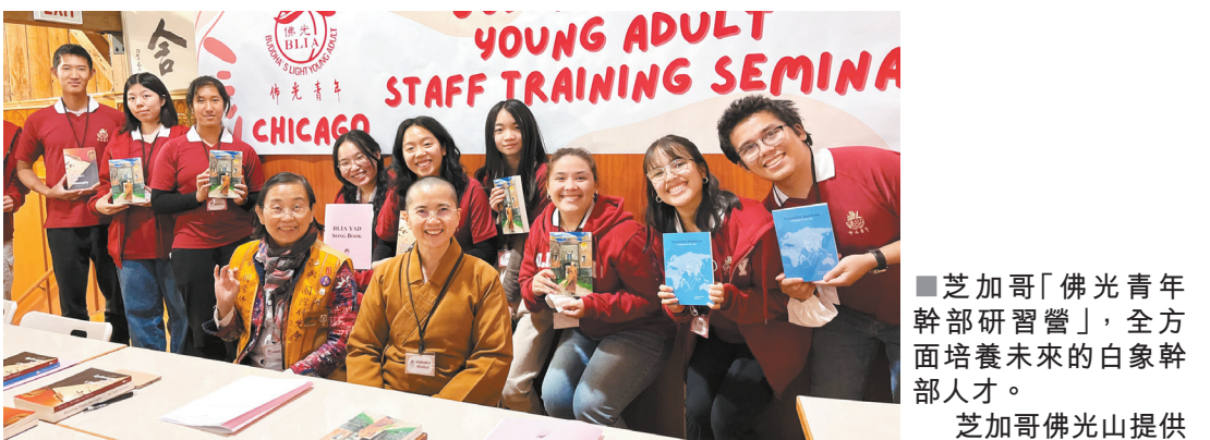
芝加哥「佛光青年幹部研習營」，全方面培養未來的白象幹部人才。