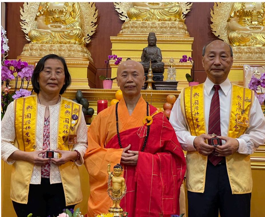
住持永嘉法師與人間佛教宣講員於浴佛亭前合影。