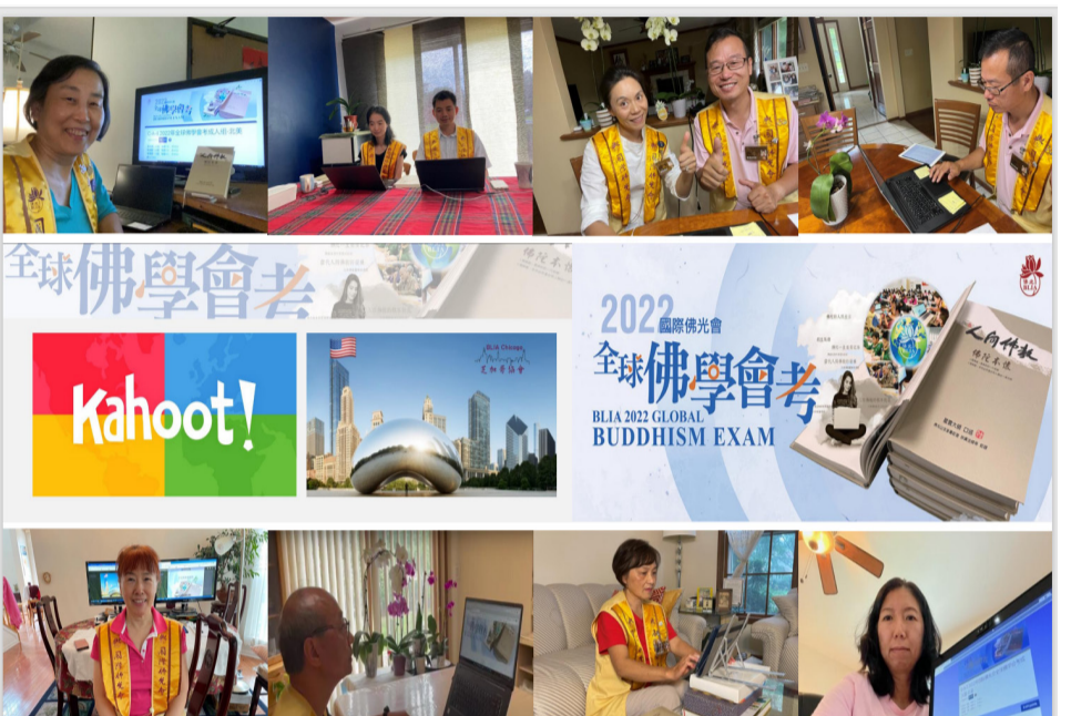
芝加哥佛光人歡喜應考