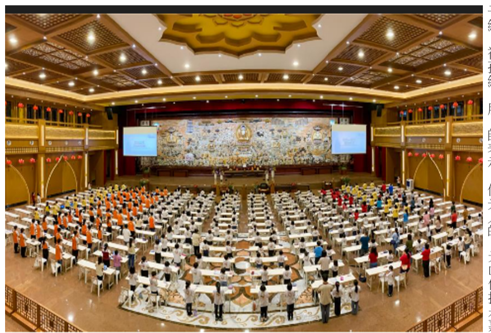
萬人上線佛學會考 全球佛光人歡喜參與